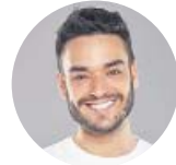
Por David Moreno Sáenz Periodista

Ni se va a acabar ni se debe acabar nunca. En España vamos de modernos, de feministas, de todo... y luego no somos nada. Si una entretenedora hace risas en una alfombra roja, los prehistóricos salen de sus cavernas para lapidarla. Si una triunfista destaca por su talento, versatilidad y carácter, se llenan la boca diciendo que es egocéntrica cuando en realidad lo que tiene es seguridad en sí misma. Si una cantante tarda en sacar un disco nuevo, es una vaga. En serio, en serio o como queráis. ¿Podéis parar?