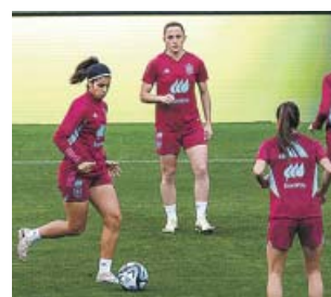
Entrenamiento de España en La Cartuja de Sevilla.

Francia recibirá a Alemania en la otra semifinal, que es también muy importante: de ganar las galas, el partido por el tercer y cuarto puesto repartirá una plaza olímpica; sin embargo, una victoria de les