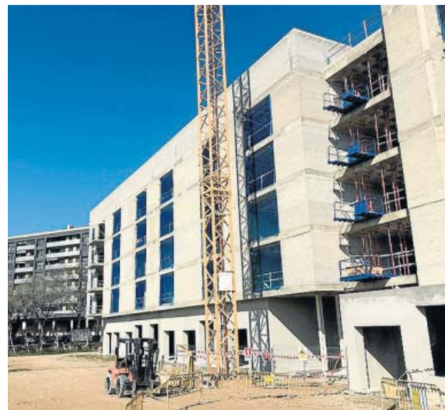
Edificio de viviendas protegidas en construcción.

En la zona B se pasará a la modalidad básica de 1.576,64 a 2.110 euros. Aquí están Alcalá de Henares, Alcorcón, Aranjuez, Arganda del Rey, Colmenar Viejo, Coslada, Fuenlabrada, Getafe, Leganés, Móstoles, Parla,