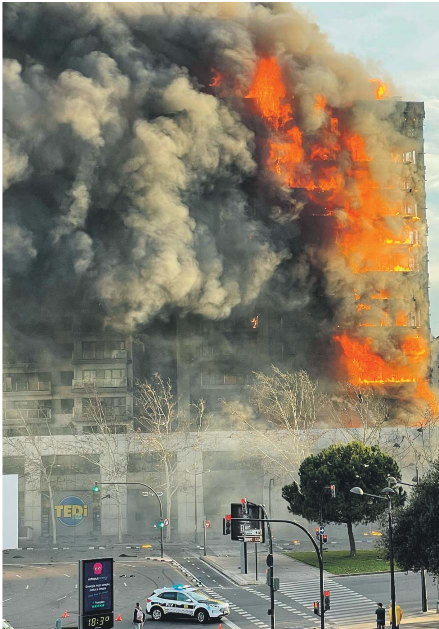
Imagen de la fachada del edificio durante la primera hora del incendio cuando comenzaban los trabajos de extinción.

La labor de los Bomberos fue titánica y se vivieron momentos de mucha tensión, con dos personas que habían quedado atrapadas en un balcón, y a las que los bomberos finalmente pudieron rescatar, tras unas horas, con dos grúas, entre los aplausos de los vecinos concentrados en las cercanías del lugar. En otro caso, extendieron un hinchable sobre la calzada para que un bombero se lanzara a la calle desde un primer piso tras realizar labores