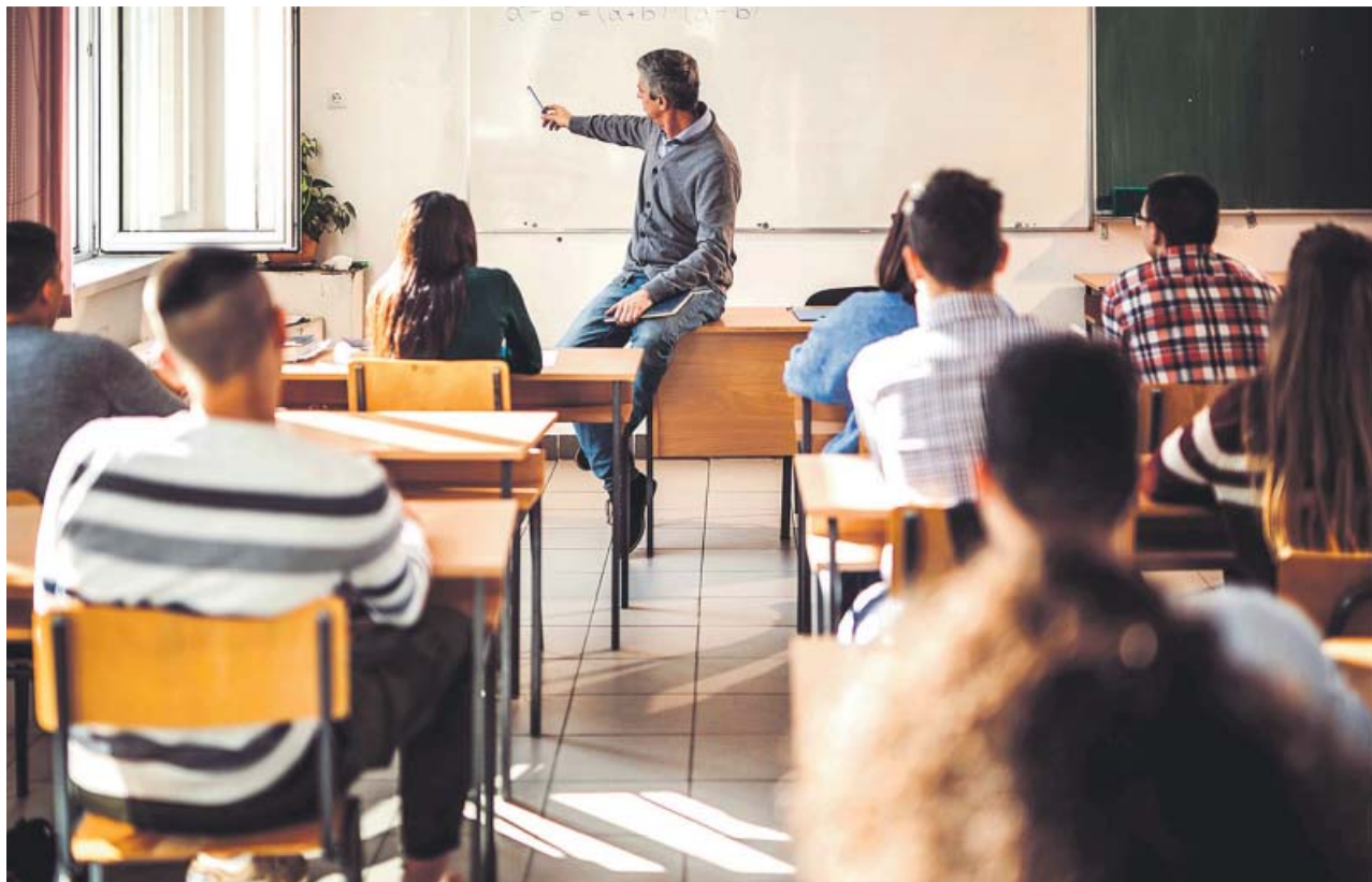
Un profesor imparte una clase en Secundaria.

«Por consiguiente, en las situaciones examinadas, la convocatoria de esos procesos dentro de los plazos establecidos puede prevenir, en principio, los abusos derivados de la utilización sucesiva de relaciones laborales de duración determinada a la espera de que dichas plazas se cubran de manera definitiva», termina el TJUE. ●