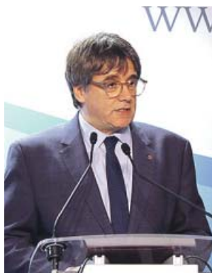
Carles Puigdemont, en una imagen de archivo.

En el documento, de 31 páginas, se concluye que los hechos «sucieron sin que pueda cuestionarse que se produjeron