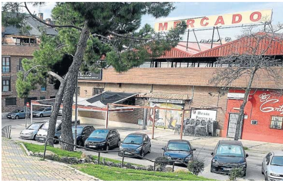
Fachada trasera del mercado de Numancia, junto al parque del Pico de la Maliciosa.