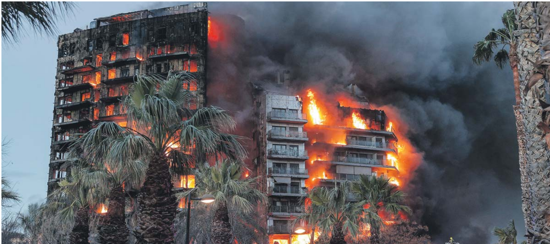
Vista general del incendio declarado en la tarde de ayer en un edificio del Campanar de Valencia y que se propagó rápidamente.