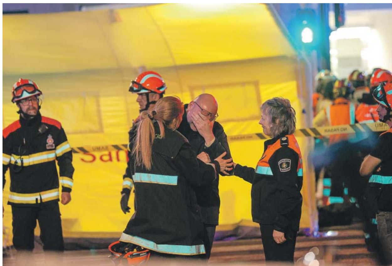
Un vecino atendido por los equipos de emergencia junto al hospital de campaña.

También las autoridades trasladaron ayer su solidaridad con los afectados. Los Reyes enviaron un mensaje en la red social X en el que trasladaron su «máximo apoyo a los servicios de emergencias» y «los mejores deseos de recuperación a los heridos». «Nuestro corazón está con los valencianos», concluyeron. Por su parte, el presidente del Gobierno, Pedro Sánchez quiso también trasladar su «solidaridad» y se mostró «consternado». Por su parte, el líder de la oposición, Alberto Núñez Feijóo, dijo seguir «con mucha preocupación» las noticias y tuvo un mensaje de apoyo a todos los profesionales que trabajaban en el fuego. ●