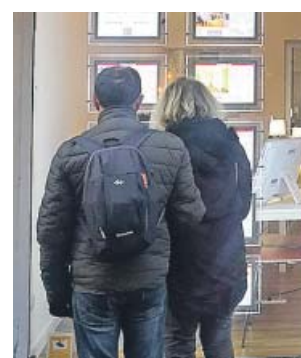
Una pareja mira las ofertas de una inmobiliaria.

Puede leer esta y otras noticias de actualidad en 20minutos.es