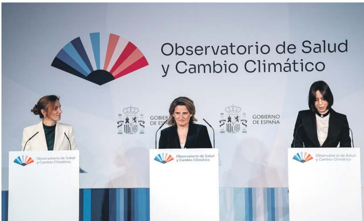
De izquierda a derecha: las ministras Mónica García, Teresa Ribera y Diana Morant durante la presentación del OSCC.