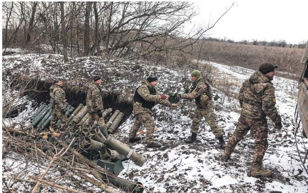
Soldados ucranianos descargan explosivos, ayer, desde un camión en su posición de combate, cerca de Bajmut.

Ucrania lucha contra el olvido. La ofensiva israelí sobre la Franja de Gaza ha movido el foco internacional que estaba centrado en la guerra en su país. Los aliados diversifican ahora su apoyo económico y tratan de repartir la ayuda a ambos conflictos. Recuperar ese interés político será otro de los desafíos que Zelenski tratará de combatir en 2024. Mientras tanto, en Kiev el paseo se ve interrumpido por el sonido de un teléfono que advierte de una alarma antiaérea. La guerra continúa. ●