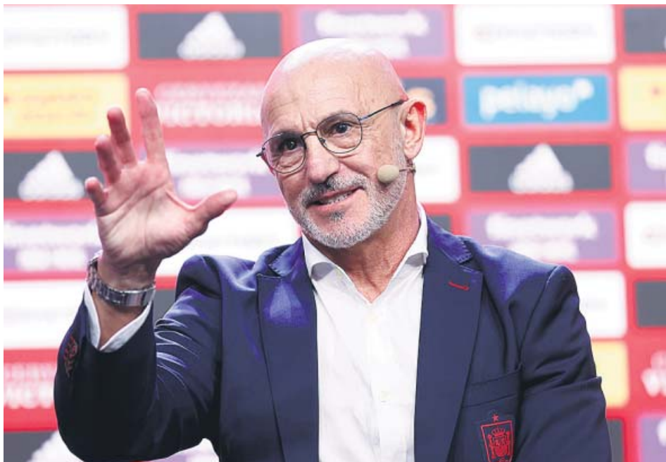
Luis de la Fuente, seleccionador español de fútbol.

El contrato de Luis de la Fuente expiraba en plena competición y el deseo de la RFEF era la renovación antes del inicio del torneo. La Comisión Gestora ha aprobado la petición, por lo que el técnico riojano firma su renovación hasta 2026 pese a la extraña situación, con un presidente interino, que vive la RFEF. ●